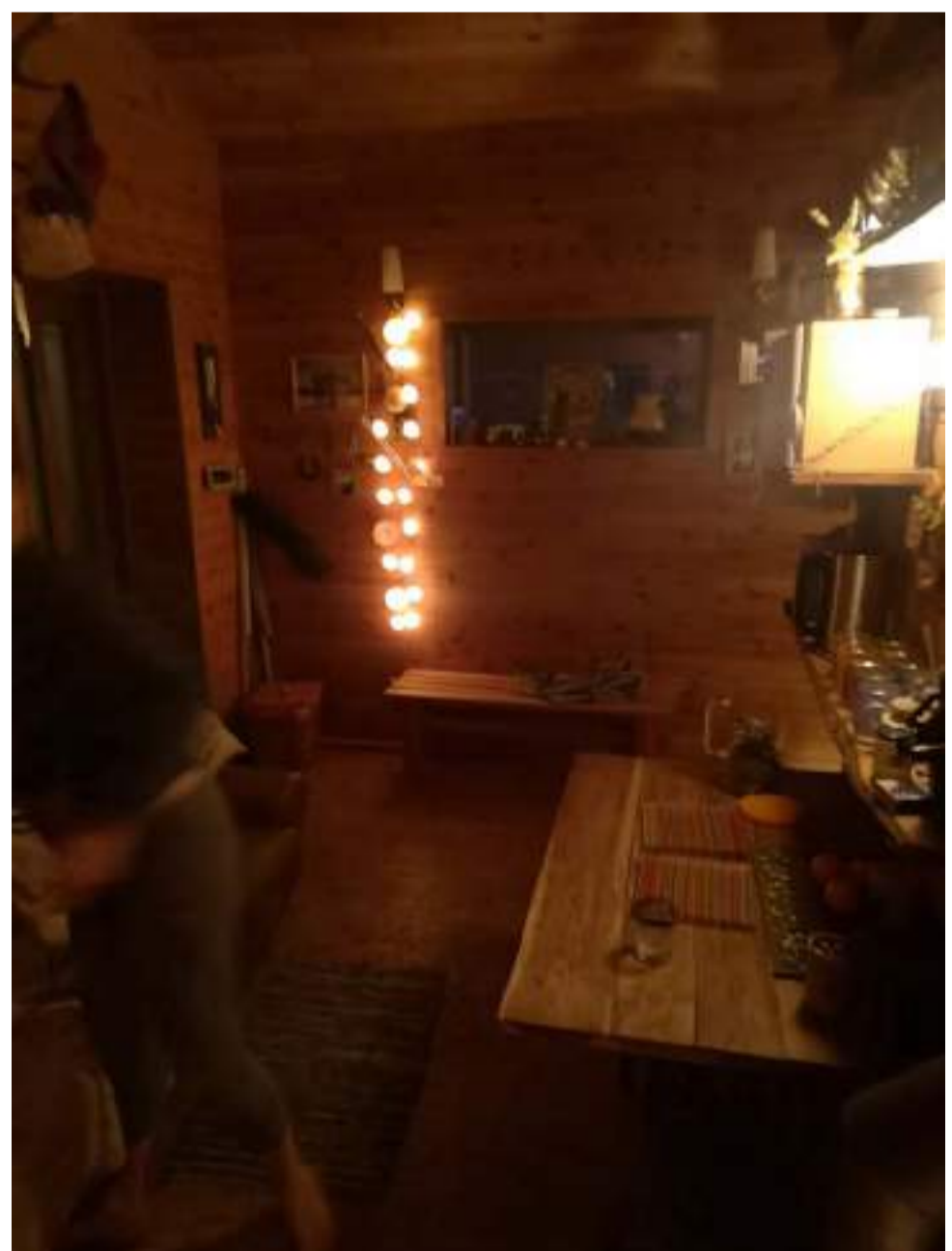
"Sauna et branches de bouleaux frais : une vraie tradition"

Pour éviter cet éventuel mal du pays, personnellement, je me dis que c'est une chance d'être là. Une réelle opportunité à saisir. Tellement de choses à faire. Franchement, le temps passe super vite. Pas le temps de s'ennuyer..."