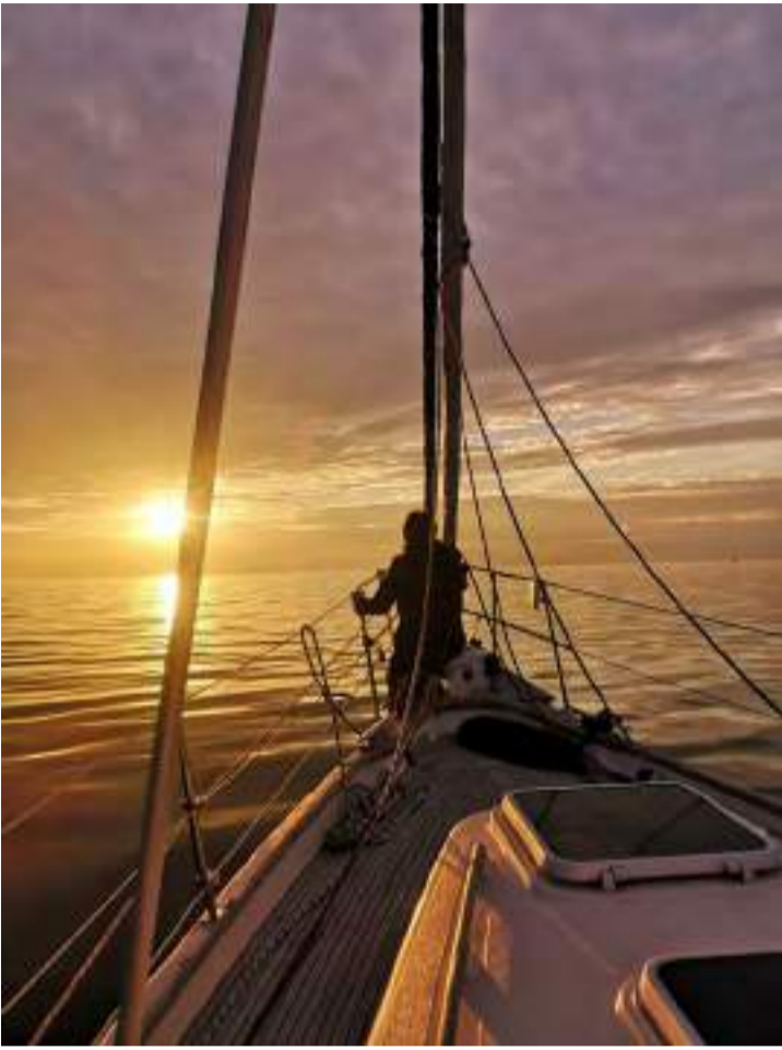
"Voilier sur la Daugava, le fleuve traversant Riga"

J'ai déjà eu la chance de voyager dans d'autres pays de l'Est telles que la Bulgarie, la Pologne, puis des pays de l'ex-Yougoslavie. Mais, les pays baltes étaient vraiment inconnus pour moi. Un vrai défi... "