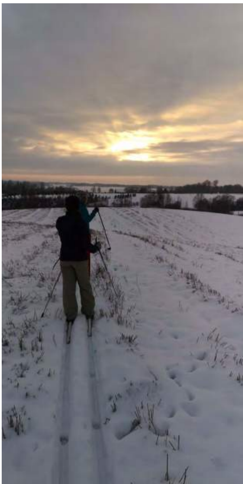
"Session de ski dans la région de Tukums"