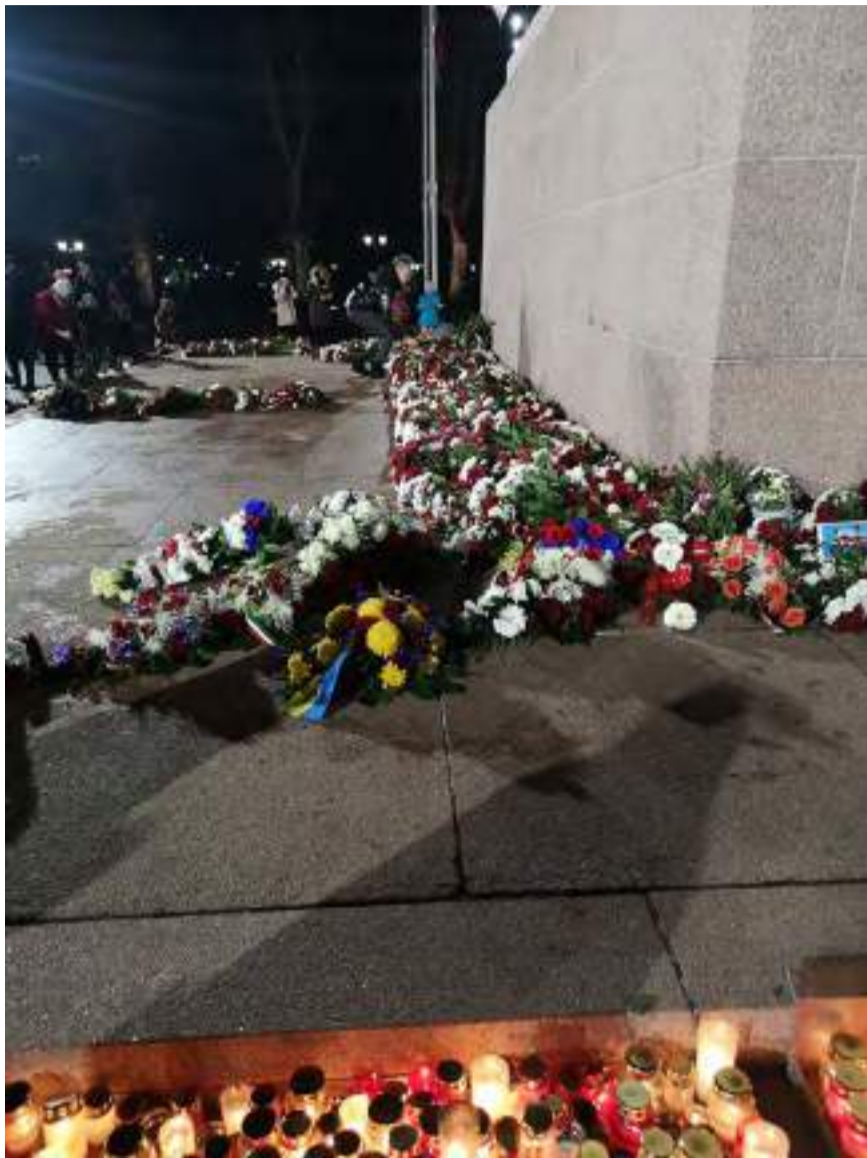
"18 novembre : Fête nationale en Lettonie"