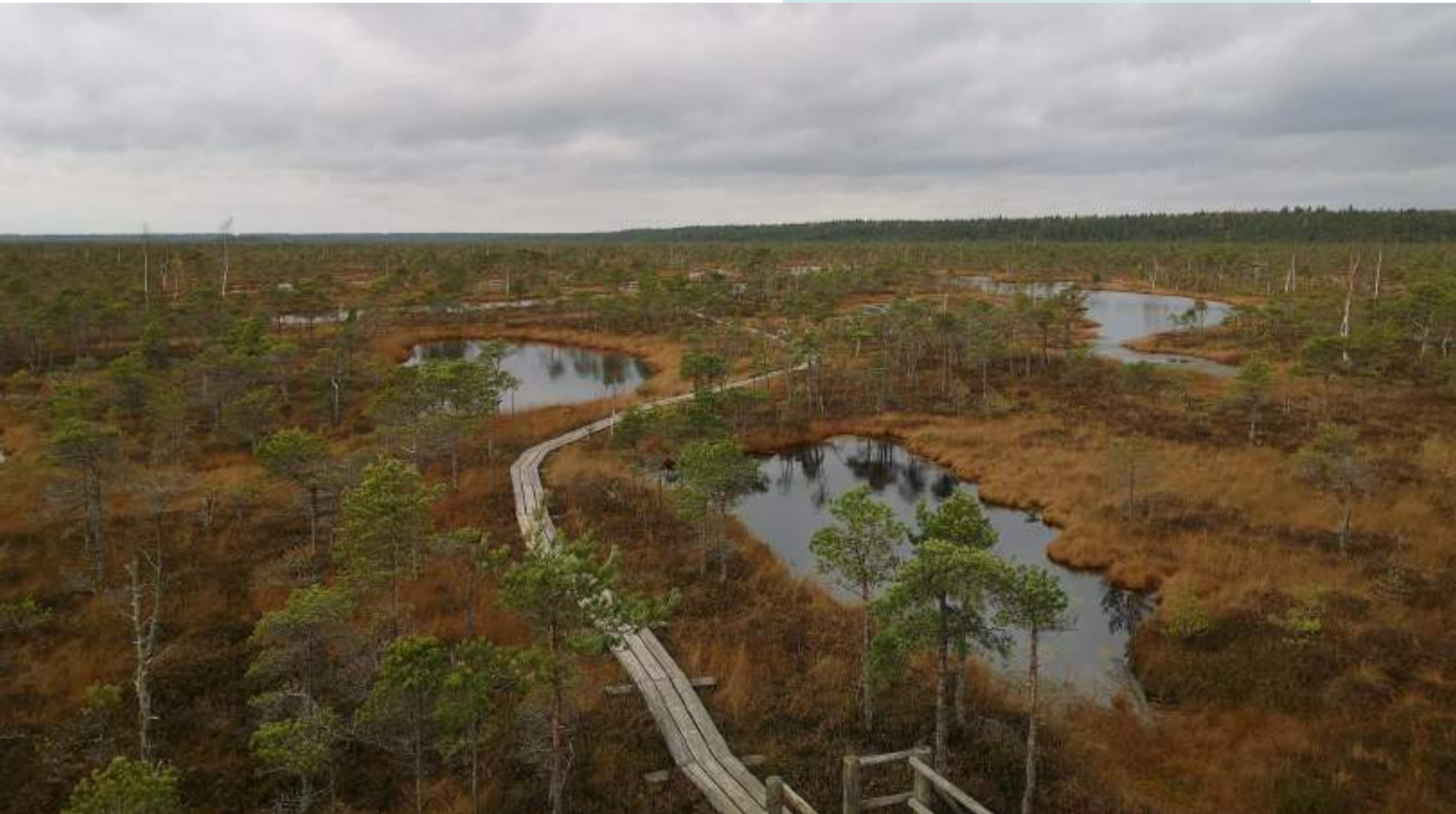
"Parc national de Kemerii"